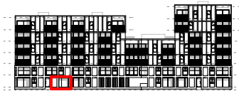
gevel west - kanaalzijde