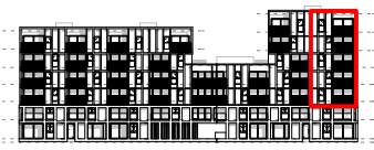
gevel west - kanaalzijde